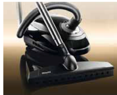
CTE CONSUMER DESIGN